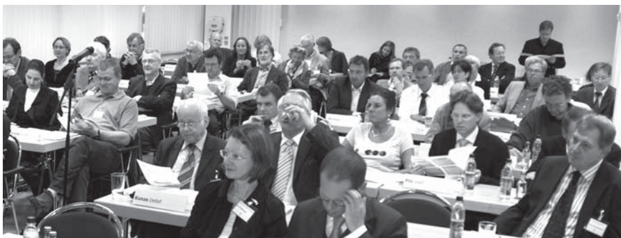
Die Delegiertenversammlung des ÄKBV.