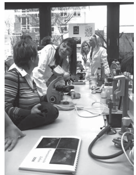
Tag der offenen Tür in den Walner-Schulen.