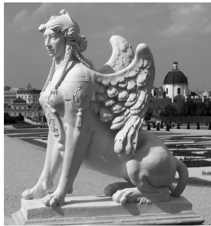
Sphinx Garten Schloss Belvedere, Wien

In dieser Ausgabe von unbeirrbar soll unter anderem das Thema „Sexualität der Angehörigen psychisch Kranker“ angesprochen werden. Es gibt etliche Arbeiten zum Thema „Sexualität psychisch kranker Menschen“, wir hatten auch schon im Landesverband ein