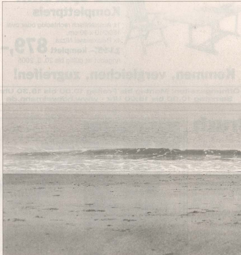
Depression: Viele Menschen leiden an dieser Erkrankung, ohne richtig behan-

Ausgehend von dieser Situation hat sich in den vergangenen Monaten sukzessive ein „Bündnis gegen Depression – Region Aachen“ gegründet, das die gemeinsame Gesundheitskonferenz von Stadt und Kreis Aachen, die jetzt erstmals tagte, unterstützt. Schirmherren des