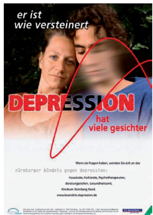
Abbildung 3: Plakat mit Leitmotiv der PR-Kampagne des Nürnberger Bündnisses gegen Depression

Erfolgskriterium prospektiv festgelegt und mit Bezug auf das Ausgangsjahr und die Kontrollregion Würzburg gemessen (Hegerl, U.; Althaus, D.; Schmidtke, A.; et al., 2006). Die Nachhaltigkeit zeigte sich in einem gegenüber dem Ausgangsjahr weiteren Rückgang der suizidalen Handlungen im Folgejahr (-32 %) nach