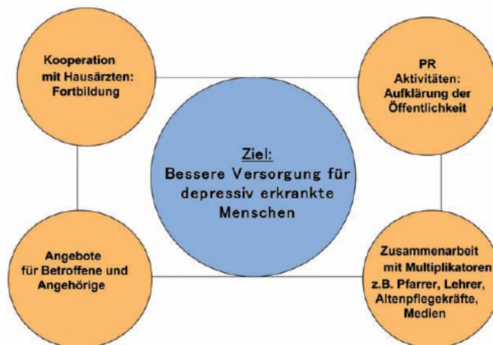
Abbildung 2: 4-Ebenen-Ansatz des Nürnberger Bündnisses gegen Depression

Mit den Kernbotschaften „Depression kann jeden treffen“, „Depression hat viele Gesichter“ und „Depression ist behandelbar“ sollten auf einfache Art und Weise wesentliche Aspekte der Erkrankung vermit-