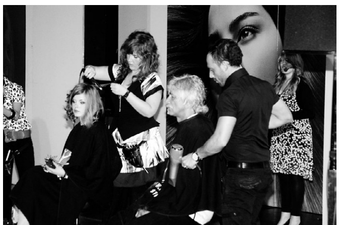
Tolle neue Frisuren wurden gezeigt.