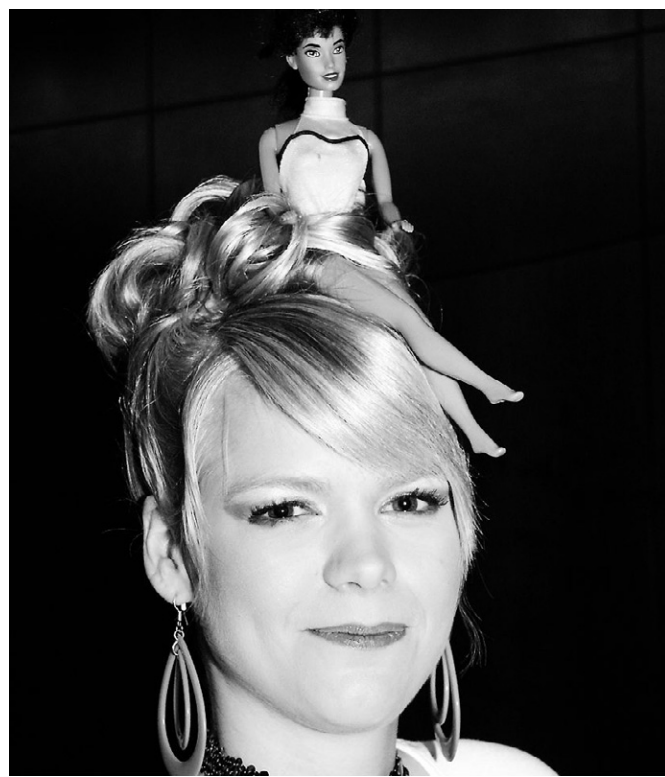
Diese kesse Barbie bezauberte alle

Frisuren der 60-er bis 80-er Jahre werden modern gestylt. Markenzeichen sind der tiefgezogene gerade Pony bei den Frauen und die Wandelbarkeit jeder Frisur. Die wenigen Frisuren für Männer wurden überstrahlt durch den Barbielook einer Gruppe