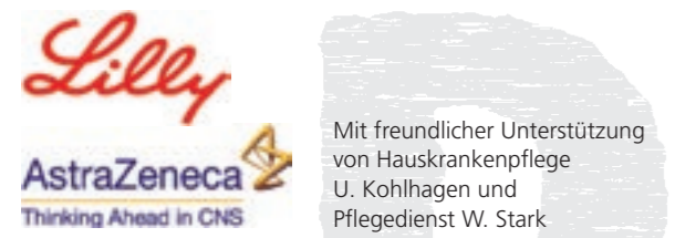
Gestaltung: www.pooix.de